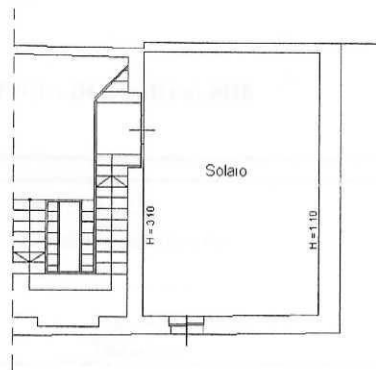
PIANO TERZO SOTTOTETTO